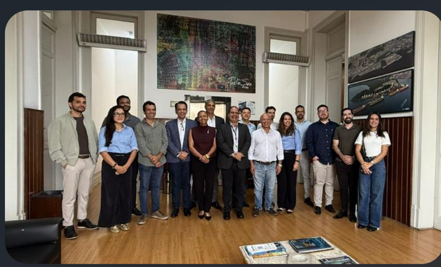
Visita na Autoridade Portuária de Santos - APS