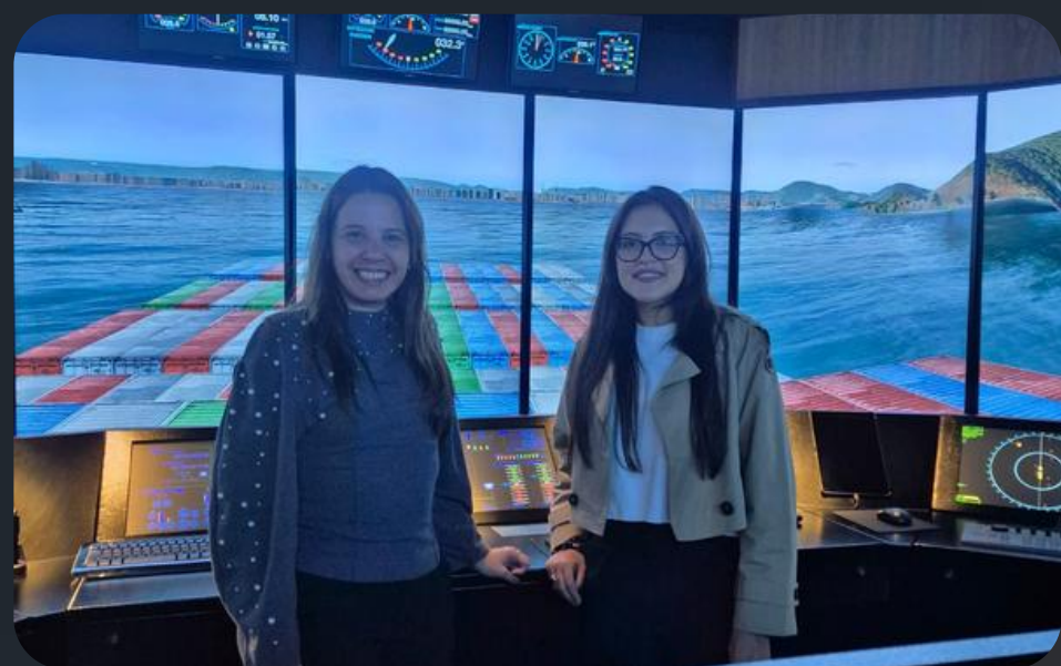
Visita na Praticagem do Brasil, em Brasília