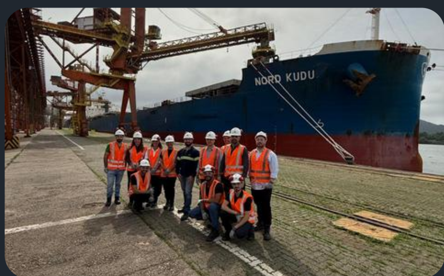
Visita na ADM