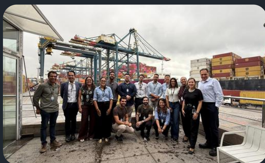
Visita na Brasil Terminal Portuário - BTP