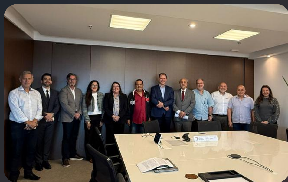
Assinatura da CCT - SOPE SP e Sindaport