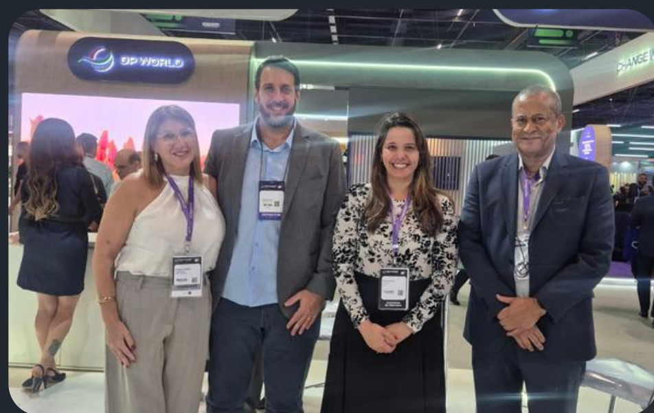
Intermodal South America com a APS