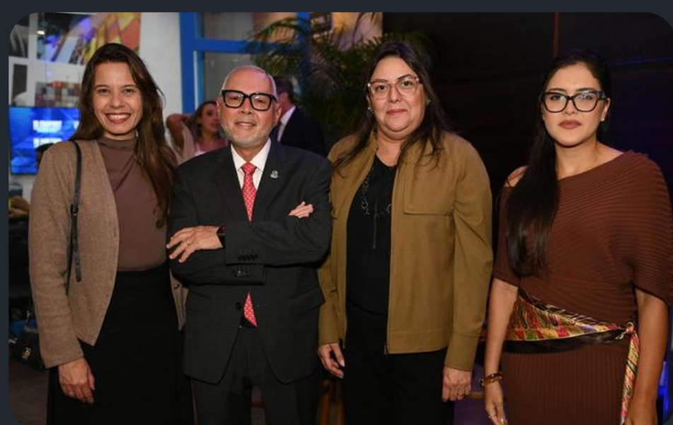
XI ENAPORT, em Brasília