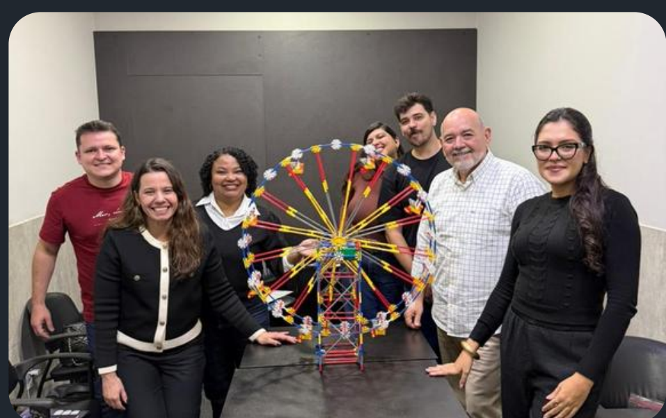
Team Building SOPE SP , em Santos