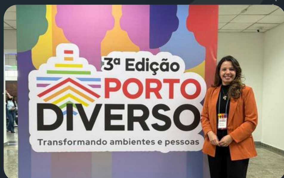
3ª edição do Porto Diverso