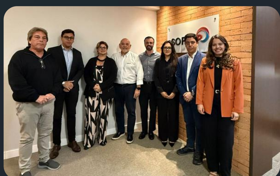
Apresentação do Santos 10+ aos secretários municipais de Santos, Guarujá, Cubatão e São Vicente