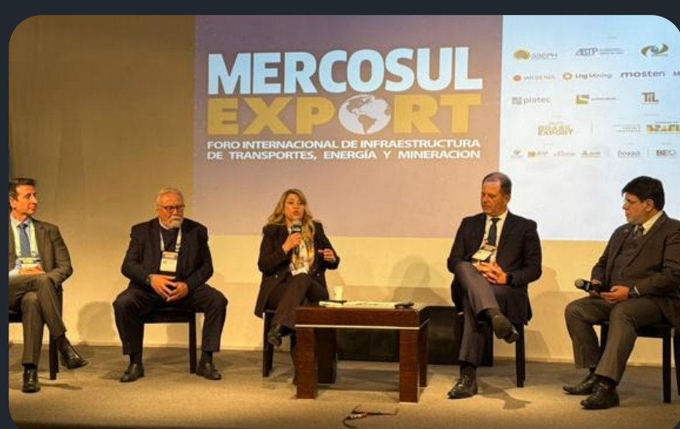
Mercosul Export - Buenos Aires, Argentina