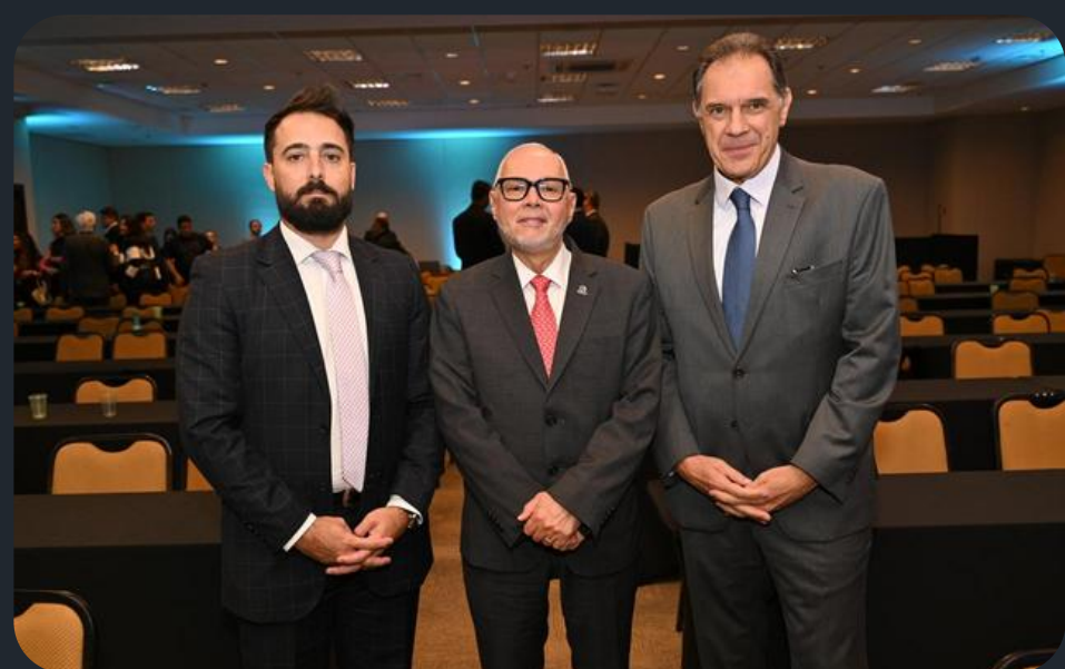
Conselheiros do Sopesp com o presidente da FENOP no Enaport, em Brasília.