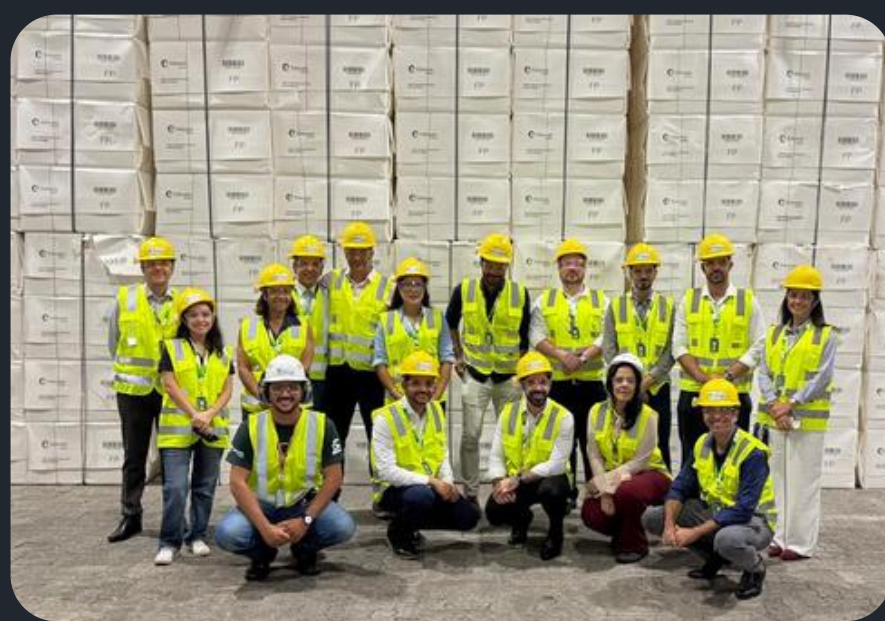
Visita na Eldorado Celulose

“É uma oportunidade essencial para levarmos os conhecimentos adquiridos aqui nos diversos terminais do Porto de Santos. Então estou bem feliz e lisonjeado de estar aqui com o apoio do SOPE SP e da FENOP. Ter essa visão macro e essa visão local no porto onde tudo acontece é fundamental para o nosso trabalho”.