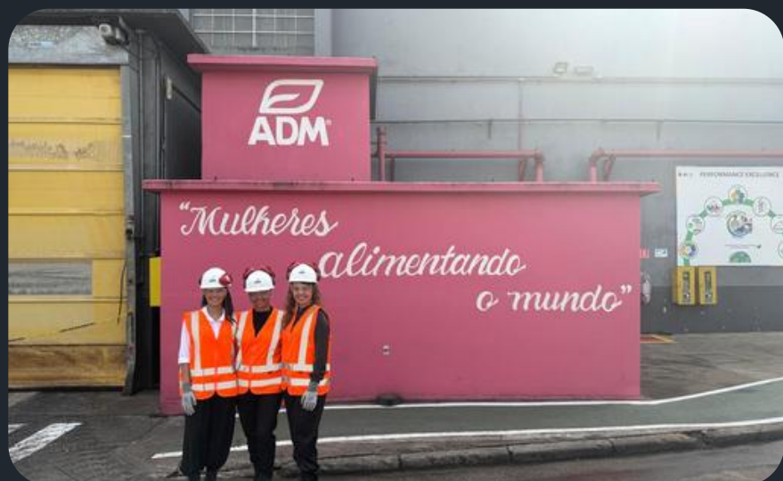
Visita na ADM